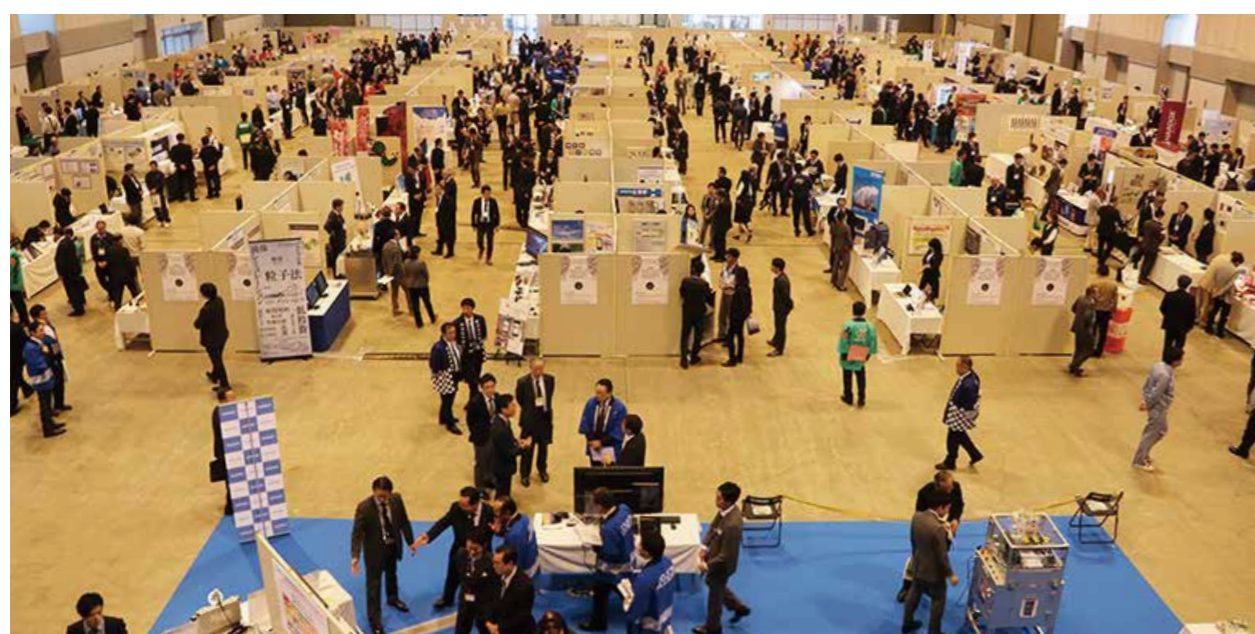
過去の展示商談会

4 新型コロナウイルス感染症拡大防止のため、例年開催している出展者説明会は中止とさせていただきます。当日の展示・商談会の運営、会場内におけるルール等を記載した出展マニュアルは各申込機関より配布いたしますので、内容をご確認ください。