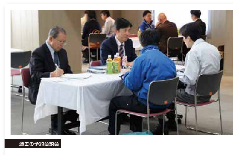
過去の予約商談会

※予約商談は、事前の商談希望調査にもとづきご用意いたします。ご希望通りの商談を組めない場合もありますので、あらかじめご了承ください。